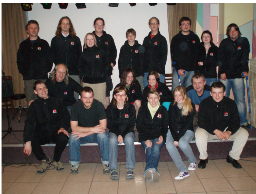
Tým Salesiánského střediska.

Děkujeme také drobným dárcům, jejichž podpory si velmi vážíme.