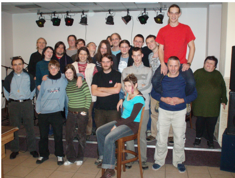
Tým Salesiánského střediska.

Děkujeme také drobným dárcům, jejichž podpory si velmi vážíme.