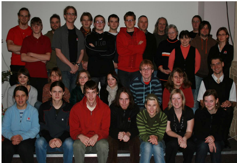
Tým Salesiánského střediska

Děkujeme také drobným dárcům, jejichž podpory si velmi vážíme.