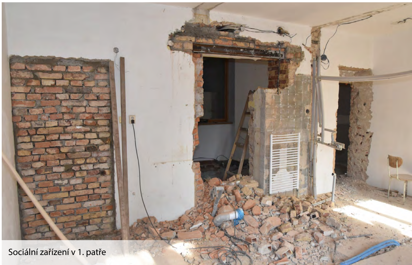
Sociální zařízení v 1. patře