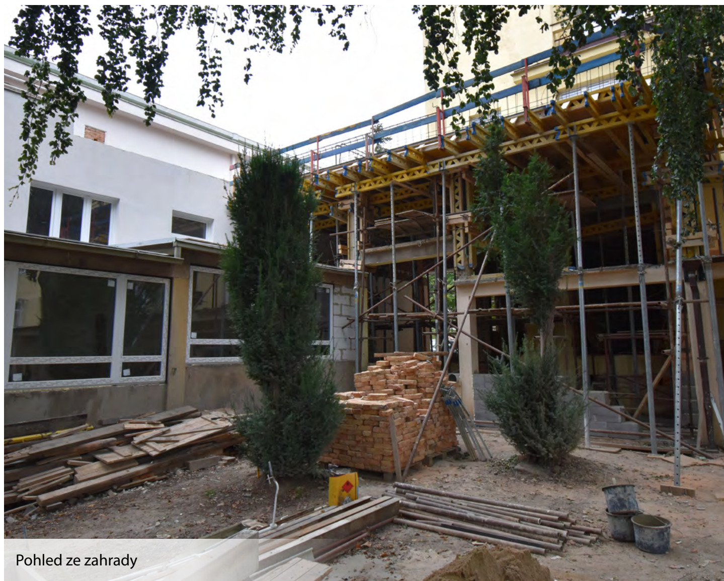
Pohled ze zahrady