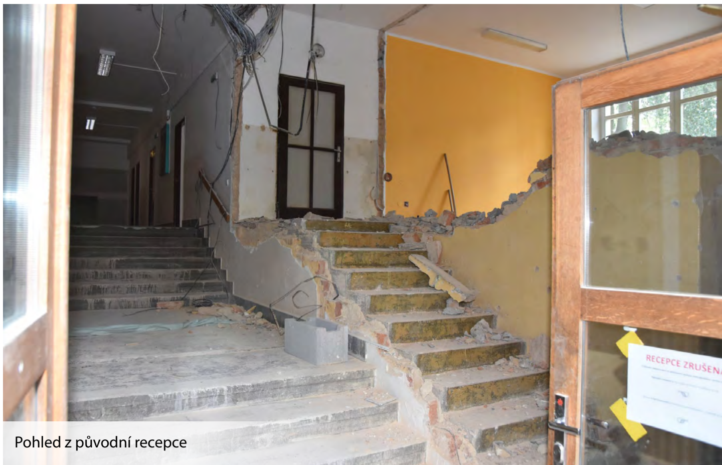
Pohled z původní recepce