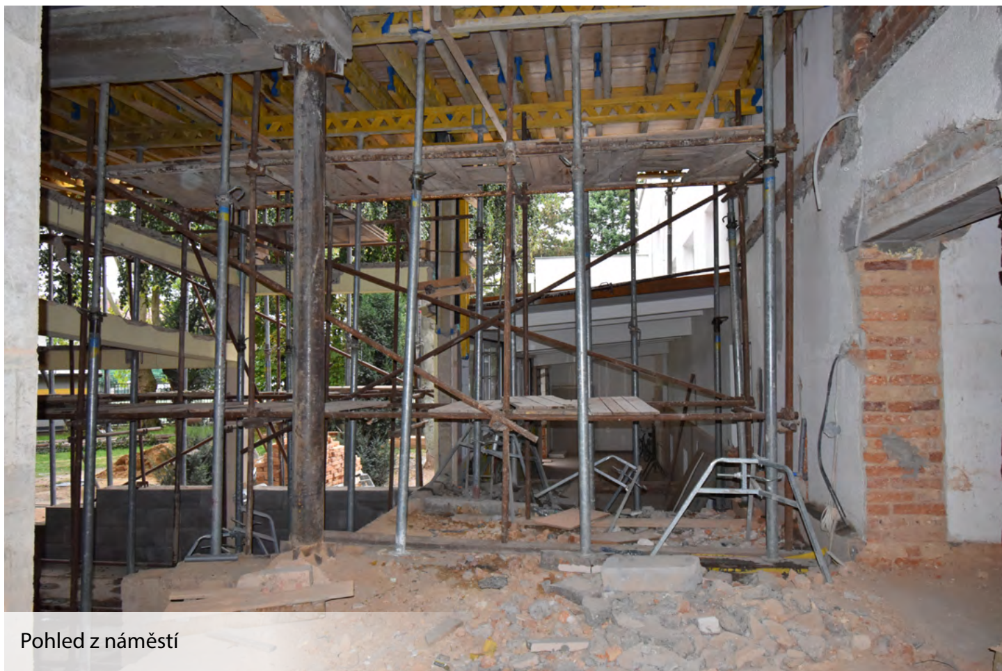
Pohled z náměstí