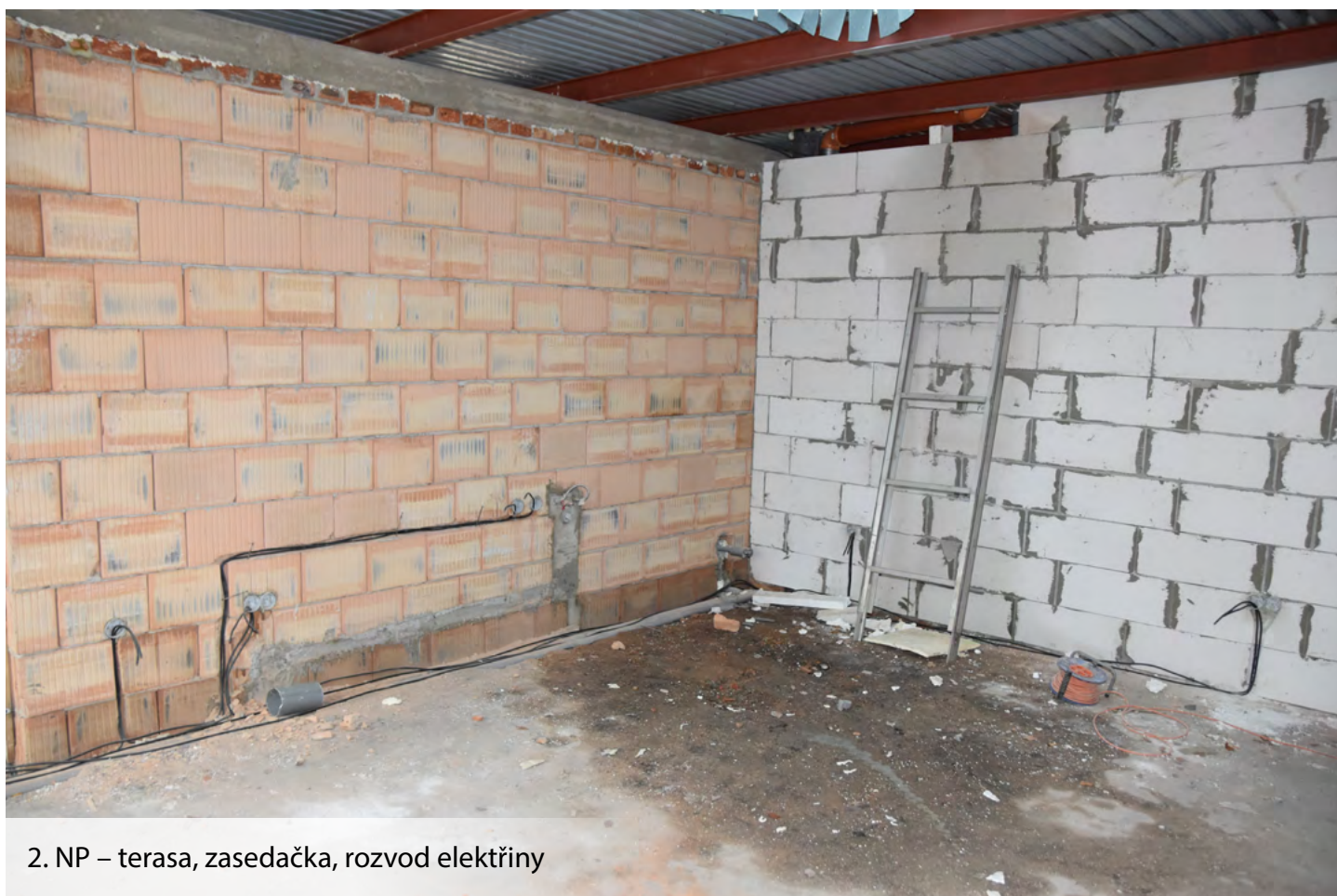
2. NP – terasa, zasedačka, rozvod elektřiny