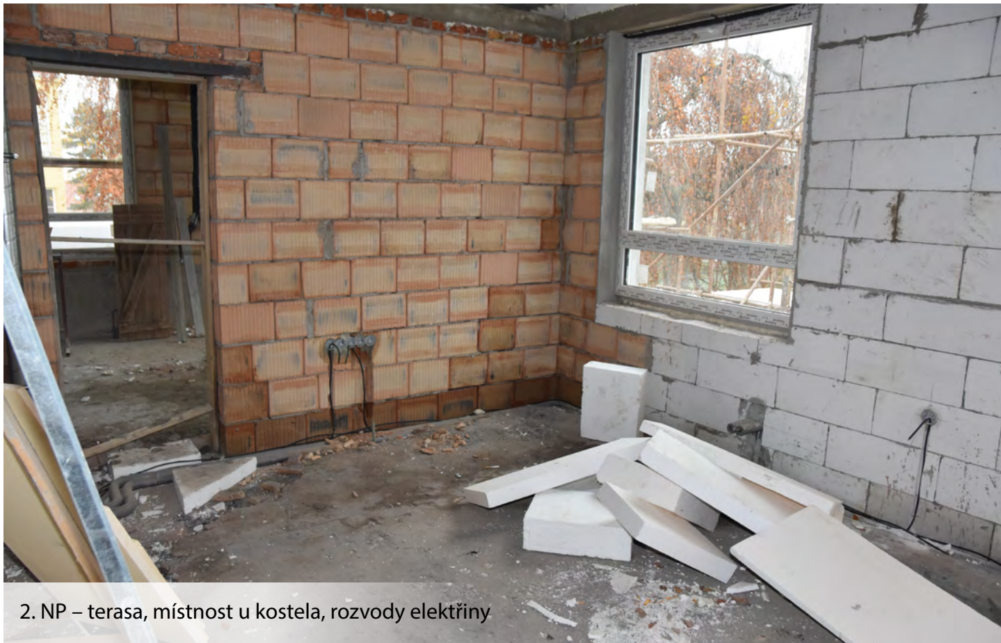
2. NP – terasa, místnost u kostela, rozvody elektřiny