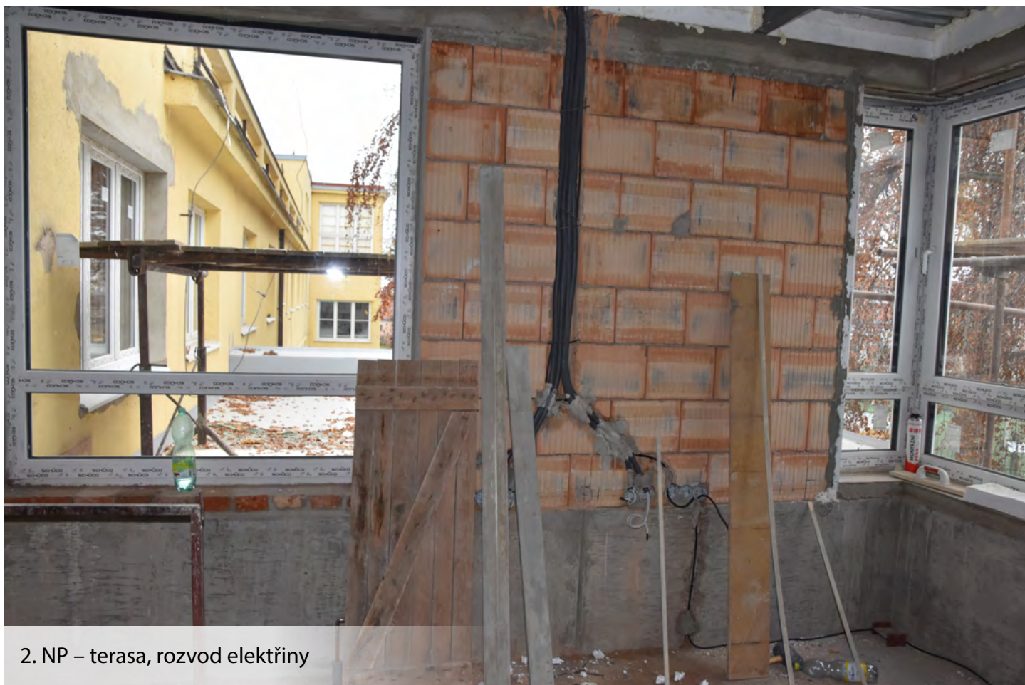
2. NP – terasa, rozvod elektřiny