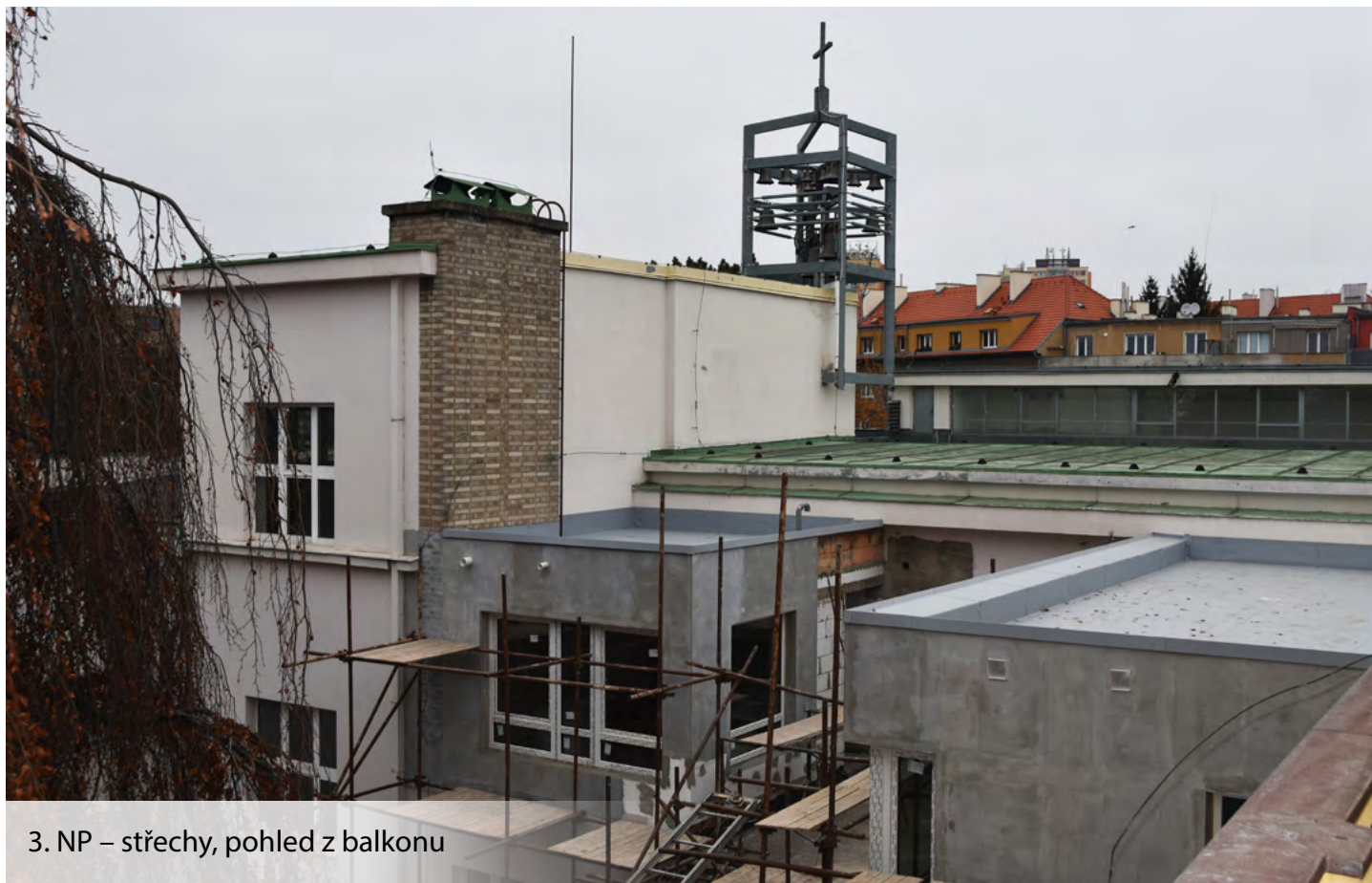
3. NP – střechy, pohled z balkonu