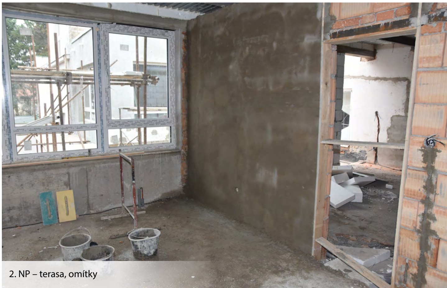
2. NP – terasa, omítky