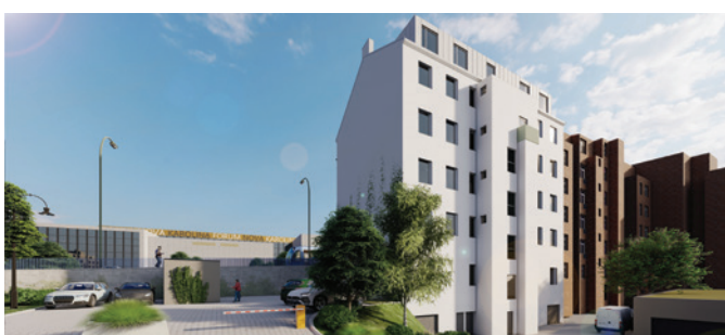
BYTOVÝ DŮM OSTRAVA