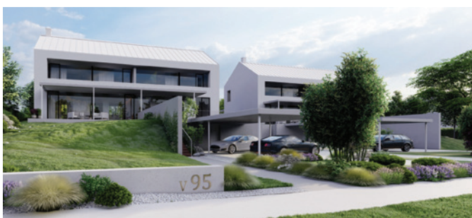
VILY VYSOKÝ ÚJEZD

Výběr developerských projektů ze současného portfolia fondu