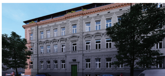
BYTOVÝ DŮM PLZEŇ