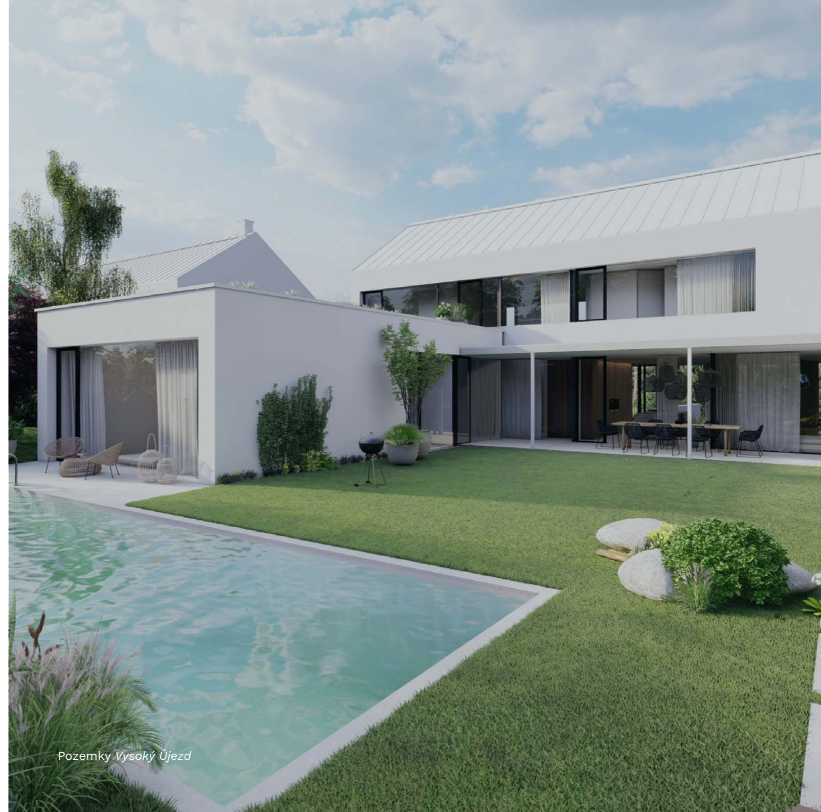
Pozemky Vysoký Újezd

1. Investice od 100,000 Kč je možná při rozložení investice ve výši alespoň 1 mil. Kč mezi více FKI obhospodařovaných u CODYA IS; 2. Preferovaný výnos slouží jako ochrana pro investory: jakýkoliv zisk může být distribuován zakladatelům fondu až po dosažení plné výše výnosu pro investory; 3. 0 % při investici přímo přes zakladatele fondu; 4. Kalkulováno z aktuální hodnoty investiční akcie; 5. Manažerský poplatek 1,6 % p.a. dle statutu je účtován z hrubého výnosu fondu před distribucí investorům a nesnižuje následně preferovaný výnos pro investory.