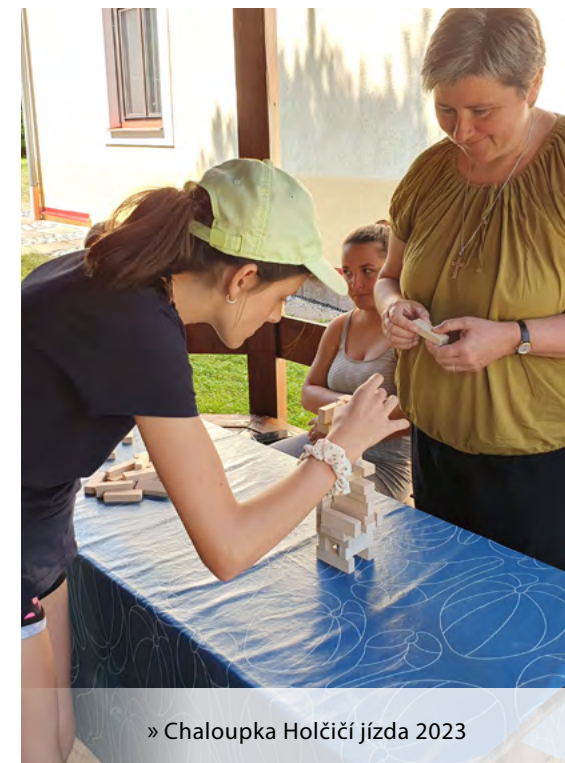
» Chaloupka Holčičí jízda 2023

Mým působištěm byl dlouho Karlín. Nejdříve jsem pracovala na intru jako vedoucí vychovatelka, pak jsem na chvíli řídila tamní střední školu. Následovala studia v zahraničí a poté opět návrat do Karlína na pozici vedoucí vychovatelky (7 let). Poté jsem prožila 9 let v komunitě v Plzni a ve středisku mládeže ve Skvrňanech, kde jsem byla zodpovědná za dílo.