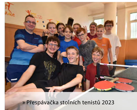
» Přespávačka stolních tenistů 2023

Film: na zamyšlení, podle skutečných událostí, detektivky