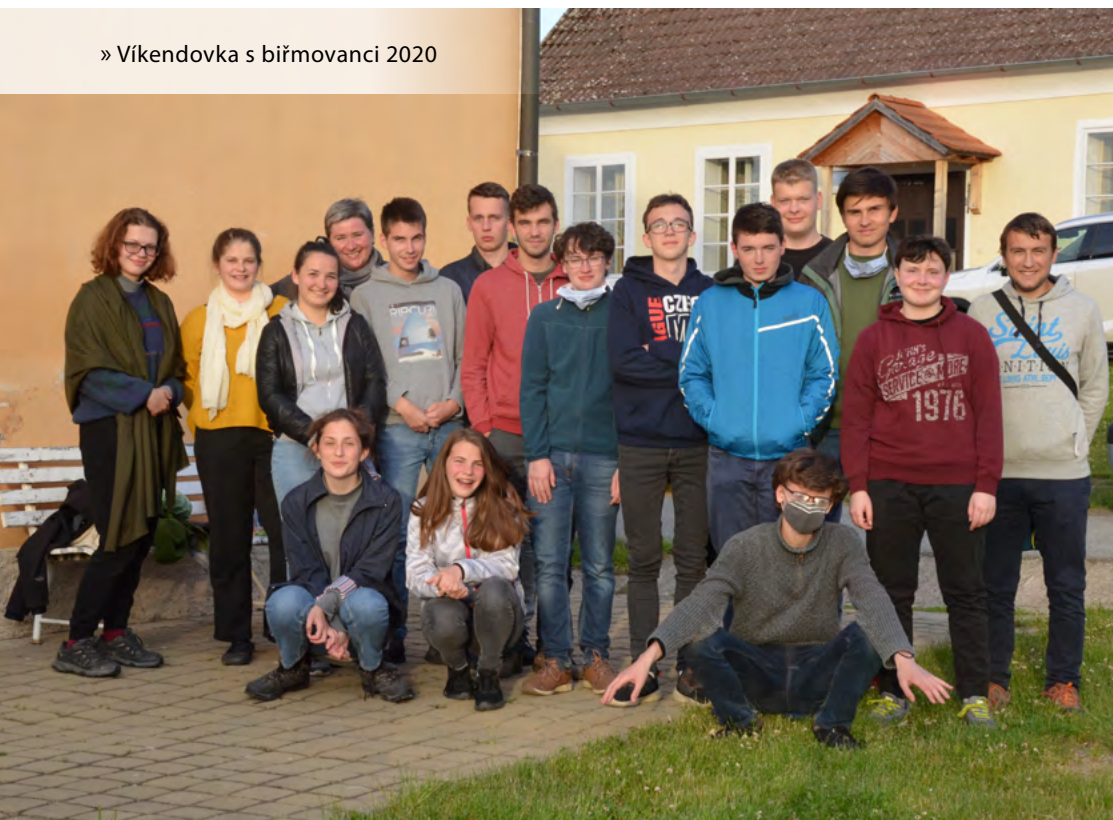
» Víkendovka s biřmovanci 2020

To se každým rokem trochu mění. Pro ilustraci třeba v uplynulém školním roce fungovalo pod naším sektorem